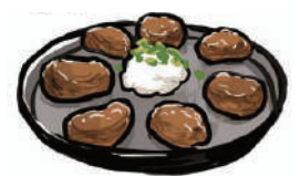
写真・イラストはイメージ